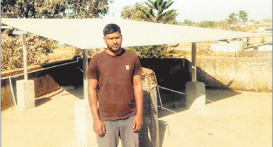
सूर्यघर योजना के तहत लगाया गया प्लांट।

सरगुजा में पीएम सूर्य घर योजना को लेकर चलाए गए अभियान में कोई खास सफलता मिलती नजर नहीं आ रही है। 46 सौ ने कराया है रजिस्ट्रेशन, अभी भी जागरूकता की कमी बड़ी चुनौती