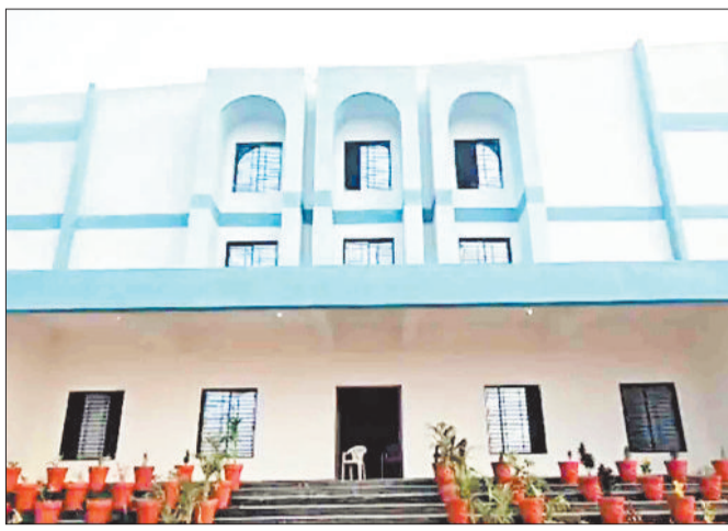
एसजीजीयू का प्रशासनिक कार्यालय।

किसी भी विश्वविद्यालय की पहचान उसके शोध कार्यों एवं शैक्षणिक गतिविधियों से बनती है। एसजीजीयू द्वारा प्रारंभ से ही विभिन्न शैक्षणिक विभागों का संचालन किया जा रहा है लेकिन शैक्षणिक विभाग अभी तक अपनी खास पहचान नहीं बना सके है। इसके पीछे एक बड़ा कारण विवि के पास मूलभूत सुविधाओं की कमी को भी माना जा रहा है। एसजीजीयू द्वारा संचालित शैक्षणिक विभागों को अब तक अना भवन उपलब्ध नहीं हो सका है। सभी शैक्षणिक विभाग उधार के भवन में संचालित हो रहे है। एक-एक कमरे में विभागों का संचालन होने के कारण अब तक शैक्षणिक वातावरण तक का निर्माण नहीं हो सका है। भक्रा परिसर में प्रशासनिक कार्यालय का स्थानांतरण होने के बाद विवि प्रबंधन परिसर के निर्माणार्थीन एवं पूर्ण हो चुके भवनों को शैक्षणिक विभागों का स्थानांतरण करने की तैयारियां कर रहा है। एक परिसर में सभी प्रशासनिक एवं शैक्षणिक विभागों का संचालन होने से प्रशासनिक शैक्षिक गतिविधियों की