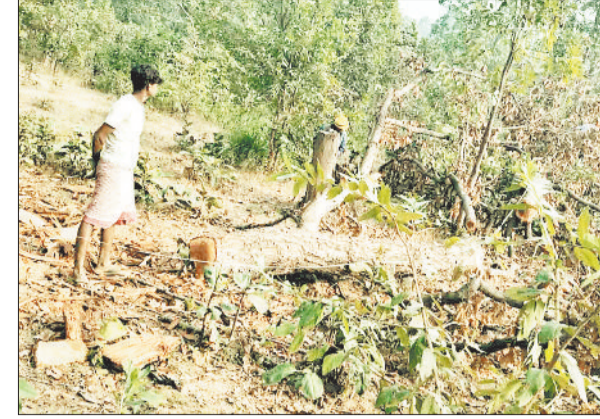
तस्करों द्वारा काटे गए पेड़।